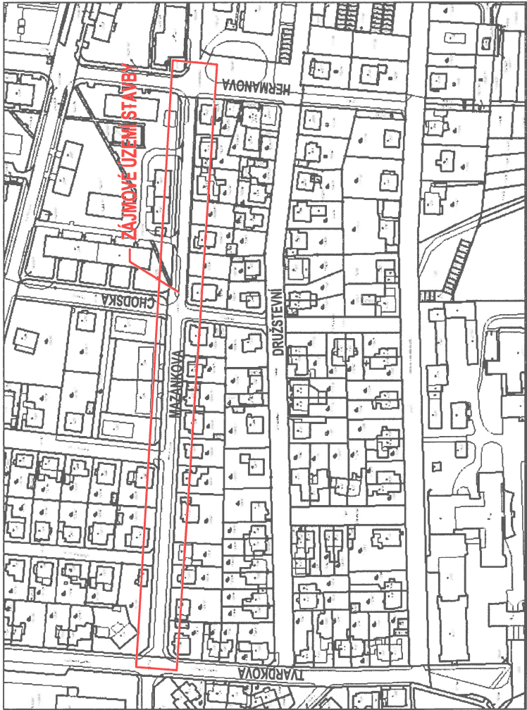
ZÁJMOVÉ ÚZEMÍ STAVBY