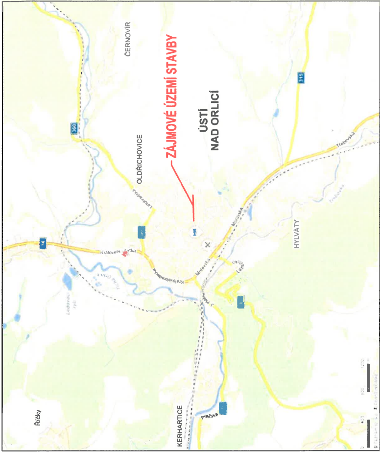
SITUAČNÍ VÝKRES ŠIRŠÍCH VZTAHŮ